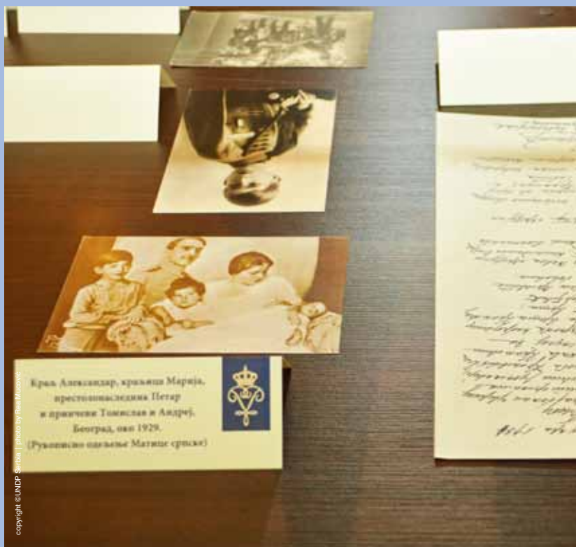
Краљ Александар, краљица Марија, престолонаследња Петар и принцезе Татјана и Андреј, Београд, око 1929.